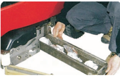
Edelstahl-Kehr-Walzenschubbaggeregat mit Grobschmutzsammelbehälter

Die von unseren Kunden seit vielen Jahren sehr geschätzte Metro-Baureihe ist vollständig überarbeitet und in eine neue Version modifiziert worden. So konnten bei der Entwicklung die gestiegenen Anforderungen an Heavy-Duty Maschinen durch innovative Produktentwicklung erfüllt werden. Die leistungsstarke Metro erbringt mit einer Arbeitsbreite von 104 oder 130 cm bei einem Wasservolumen von 250 Litern eine theoretische Flächenleistung von bis zu 8450 m 2 in der Stunde. Trotz ihrer Größe bleibt sie kompakt und übersichtlich. Hierfür sorgen z. B. eine komfortable Sitzposition und das einstellbare Lenkrad. Die kraftvolle 36V Anlage und ein starker Antriebsmotor erlauben eine stufenlose Arbeitsgeschwindigkeit von bis zu 6,5 km/h. Durch eine simple 2-Knopf-Schaltung wird die gesamte Maschine in Betrieb genommen. Die Trommelbremsen, Differentialgetriebe und die serienmäßigen Anti-Skid-Räder spiegeln das hohe Qualitätsniveau der neuen Metro wider.