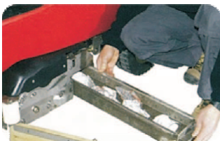
Kehr-Walzenschrubbaggregat mit Grobschmutzsammelbehälter

Die Jumbo's 862, 872 und 1002 sind kompakte Kombi-Schrubb-Kehrmaschinen, die in der Lage sind, ein enormes Ausmaß an Arbeitsleistung zu bewältigen, das normalerweise erst von Maschinen größerer Kategorie zu erwarten ist.